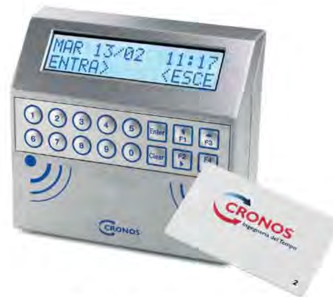
Terminale M20 prossimità

Cronos ZIP opera in ambiente Windows 95/98, NT, 2000, XP, utilizza Database Microsoft Access ed è stato sviluppato in Visual Basic 6 e Crystal Report 4,6.